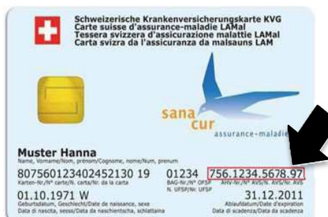
Carte d'assuré maladie