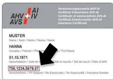
Certificat d'assurance AVS-AI